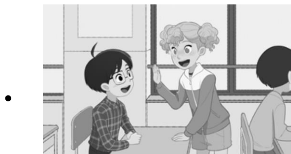
じ こしょうかい 自己紹介