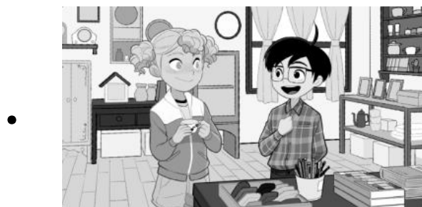
たんじょう 誕生日について