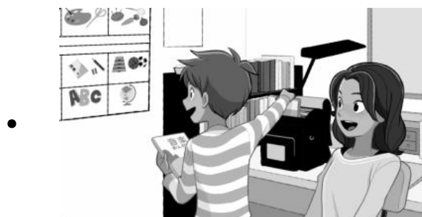
じ かんわり 時間割について