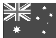
Australia ( )