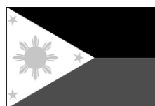
the Philippines ( )